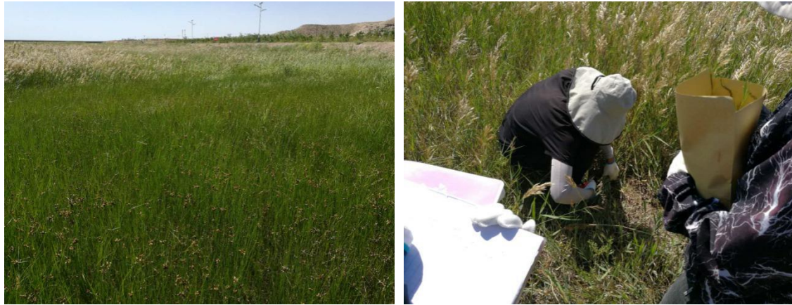
图 5.1-5 石羊河入口河道内