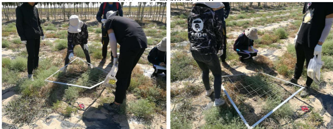
图 5.1-3 石羊河入口河道外