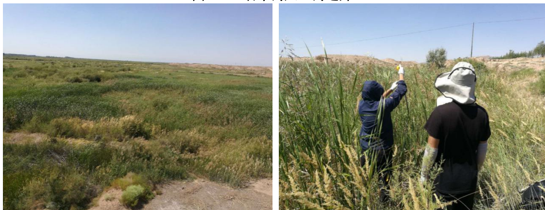
图 5.1-4 石羊河国家湿地公园