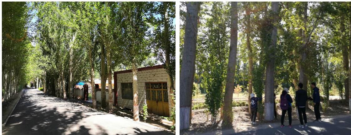
图 5.1-2 管理处附近人工林

群落生态极好，类型为草本，覆盖度为 100%，平均高度为 65cm，群落生物量为 402.96 g/m 2 ，密度蘆草为 253 株/m 2 ，芦苇为 22 株/m 2 ，群落中芦苇、蘆草占绝对优势，另外还生长有水葱、车前草、盐爪爪、芨芨草等。