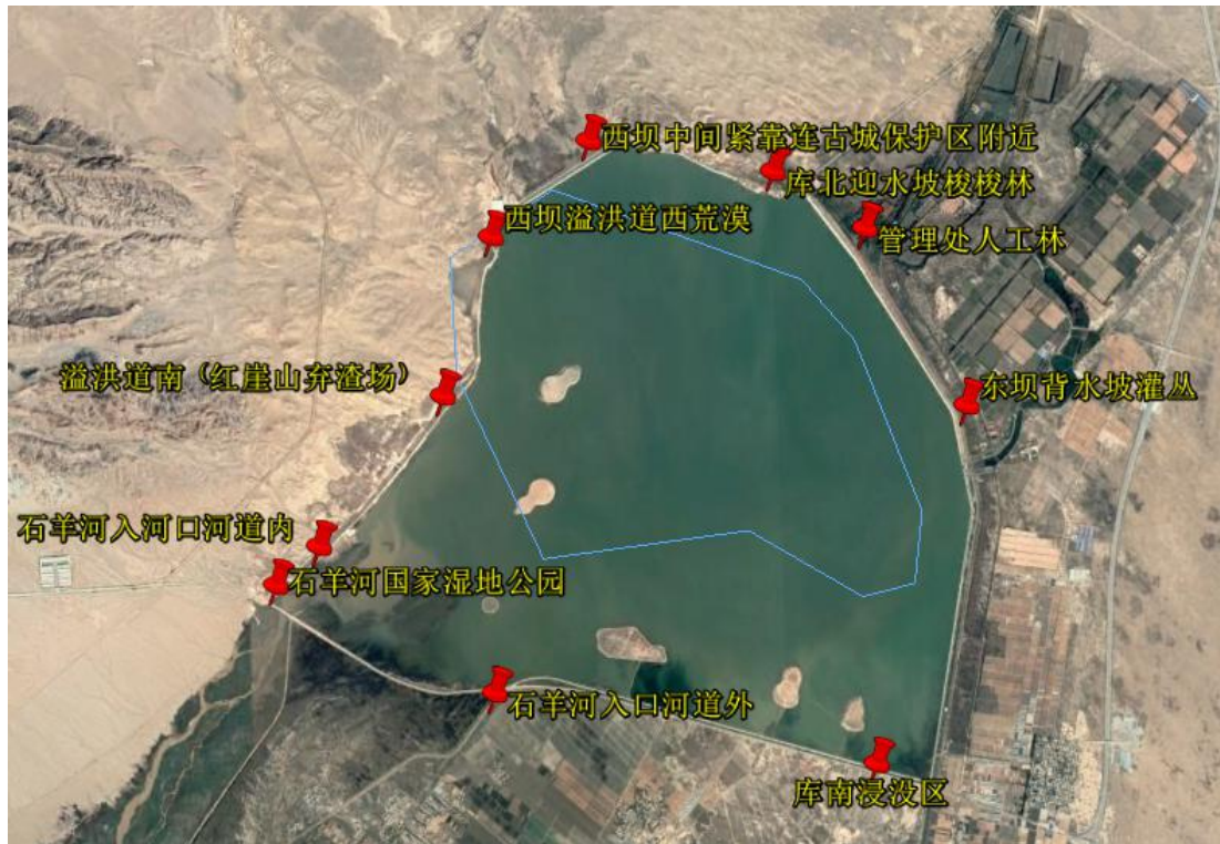
图 5.1-1 红崖山水库陆生生态监测样地位置图